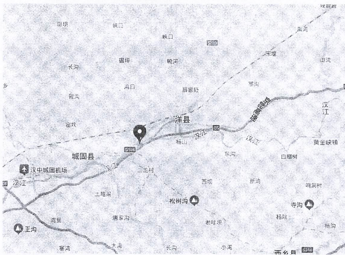
图 1 项目位置图